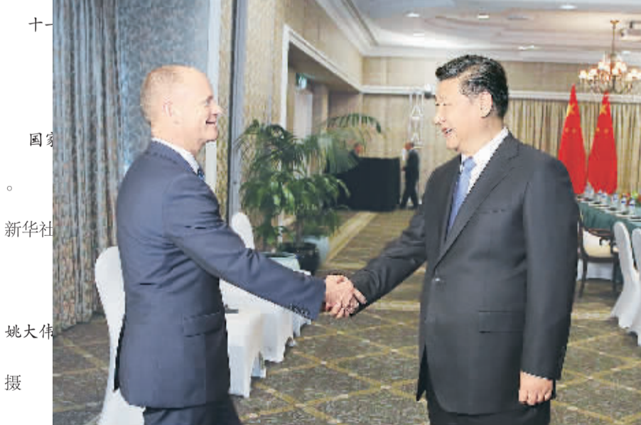
会见澳大利亚昆士兰州州长