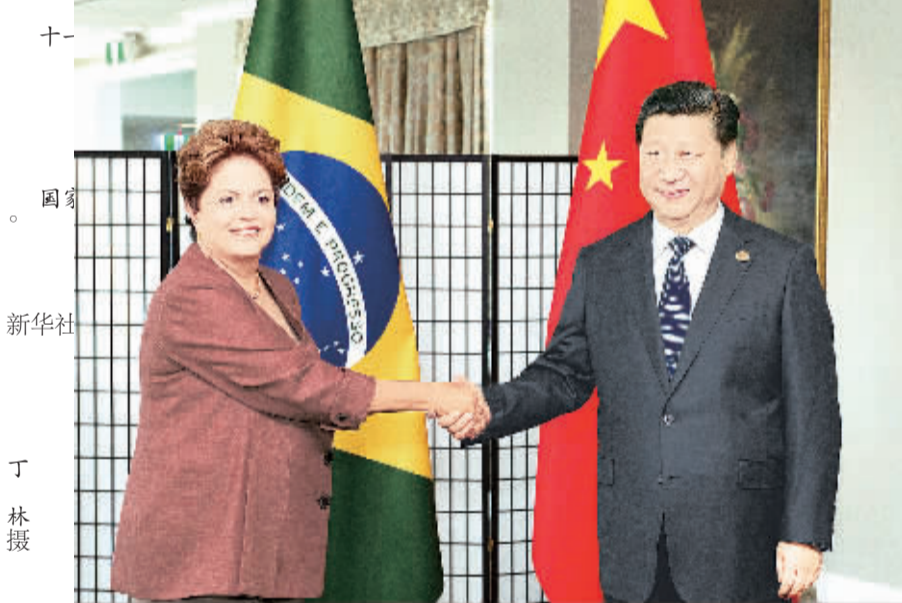
会见巴西总统罗塞夫