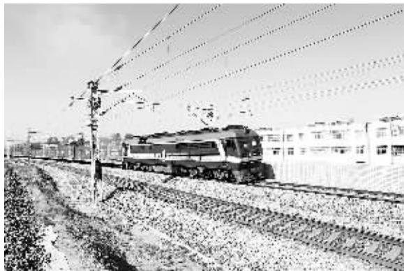
11月13日，一列货物列车行驶在黄韩侯铁路山西新绛车站区段。当日，山西侯马火车站大型扩能改造工程完工，标志着晋陕两省煤炭运输的便捷通道——黄韩侯铁路山西段率先开通运营。

报告首次从行业发展和用人单位需求角度，对工程教育的社会需求适应度进行了分析。根据对中国机械工程学会等6个行业组织的调研情况显示，我国工程教育基本适应近年来行业的快速发展需要，提供了基本满足行业需求的工程科技人员。