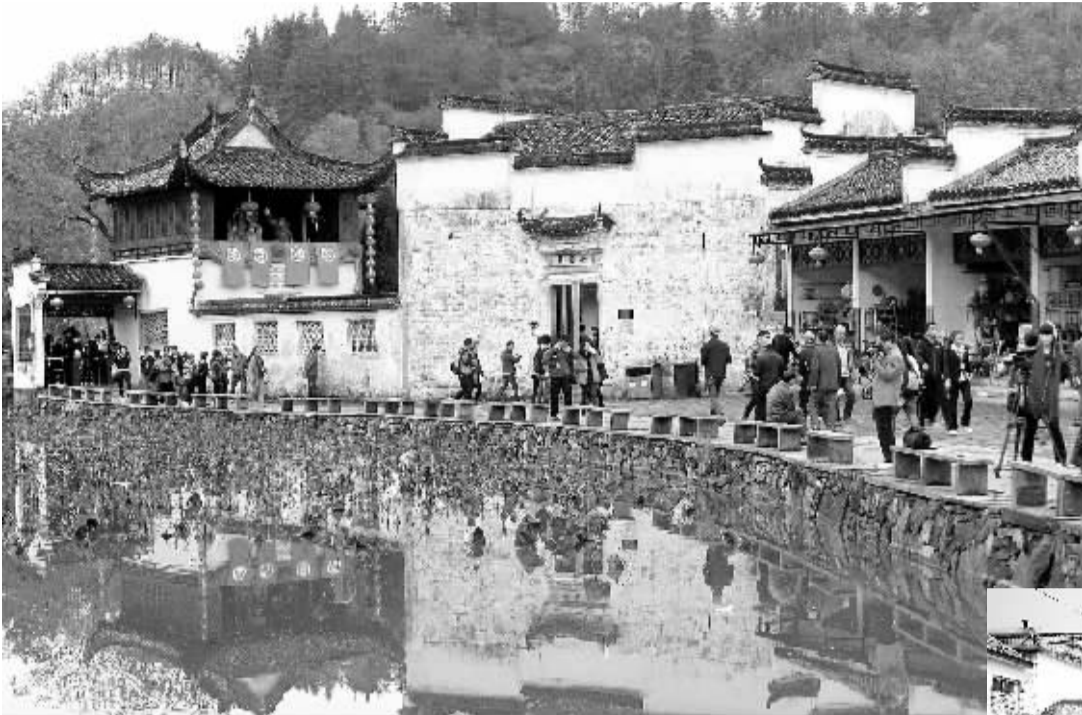
上图 11月1日,安徽省黟县西递村古村落景点,来自全国各地的游客络绎不绝。该县坚持保护与开发并重,大力挖掘文化内涵,通过开发乡村旅游,激发古村活力。