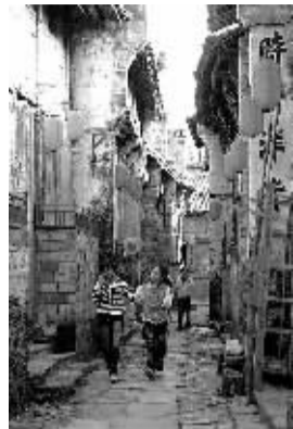
上图 江西省景德镇市瑶里镇东埠村,是一座明代古村,村内保留了较为完整的古建筑群。