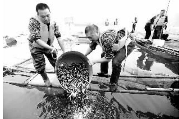
11月12日，工作人员将鱼苗从临时寄养池投入长江支流澎溪河。

据悉，目前温州市已与中交、中建、中铁、中冶、中港、中航、宝钢等开展了BOT、BT合作洽谈。