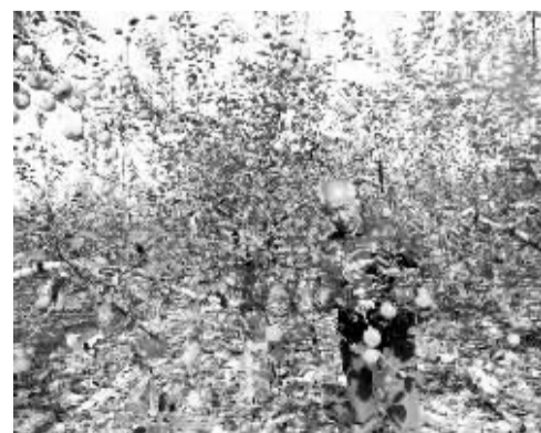
陕西省富县全面推广普及大改形、巧施肥、无公害病虫害防治和强拉枝等技术，推动了苹果产业的快速发展。预计今年富县苹果总产量将达50万吨，产值25亿元。

发展人造板产业需要大量的木材。文安县找准林业与人造板产业的契合点，大力发展周期短、见效快的速生丰产林。经过几年发展，文安县丰产林面积达43万亩，为人造板产业提供了充足的木材储备。（张少敏）