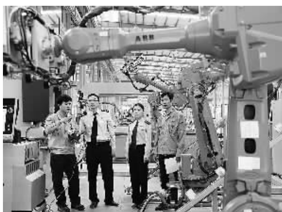
今年以来，浙江省国税局加大政策宣传，引导企业加大技改投入，积极落实增值税转型升级政策，推动全省“机器换人”走上快车道。图为南浔区国家税务局工作人员在某电梯企业了解全国首台ABB机器人投入运行情况。

值得重视的是，尽管政府职能转变的步伐较快，也取得了很大的进展，但进一步取消和下放行政审批事项还有很大空间，进一步增强宏观调控的前瞻性及针对性也还有很大余地。推进政府职能转变，目标是建设法治政府、创新政府、廉洁政府。全面正确地履行政府职能，理顺政府和市场的、政府和社会、中央和地方的关系，为经济社会发展提供良好环境，任重而道远。