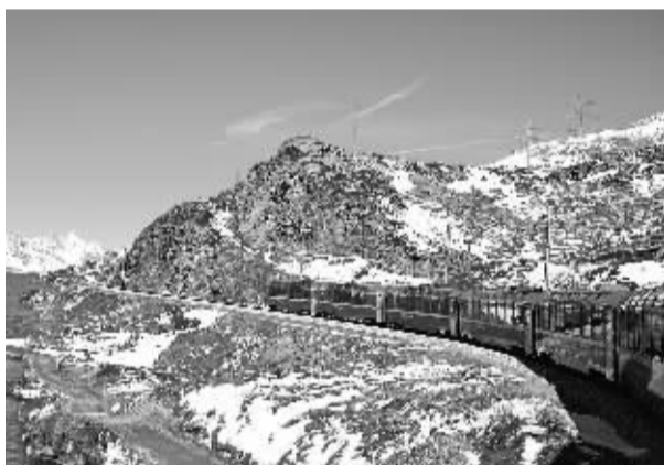
位于瑞士格劳宾登州的雷蒂亚铁路近日迎来建成125周年。雷蒂亚铁路在修建过程中攻克了诸多世界性技术难题，不仅体现了19世纪中后期人类建筑和科技发展的高水平，而且巧妙地同沿途山川湖泊和谐地融为一体。历史上它为阿尔卑斯山区人民带来了重大而深远的社会经济影响，如今其最壮观的阿尔布拉—伯尔尼纳段已被联合国教科文组织评为世界文化遗产，为瑞士经济发展贡献了高额旅游收入。