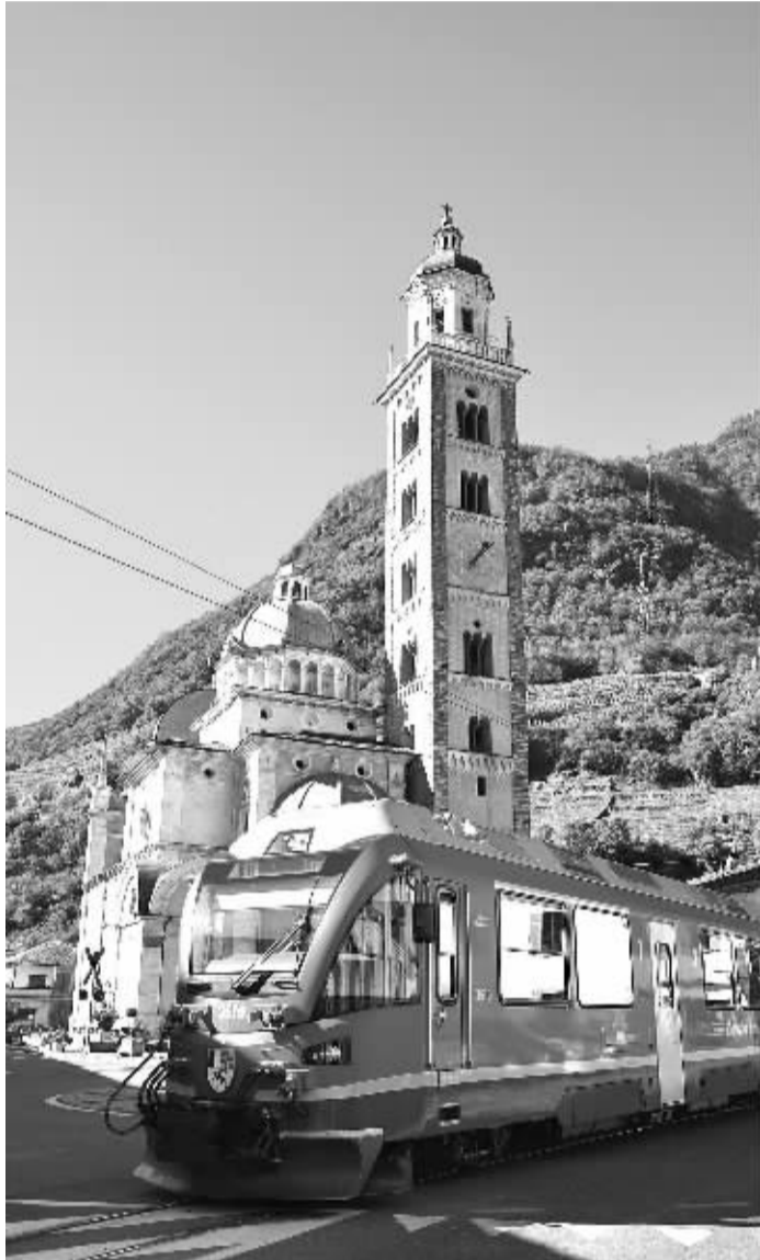
位于瑞士格劳宾登州的雷蒂亚铁路近日迎来建成125周年。雷蒂亚铁路在修建过程中攻克了诸多世界性技术难题，不仅体现了19世纪中后期人类建筑和科技发展的高水平，而且巧妙地同沿途山川湖泊和谐地融为一体。历史上它为阿尔卑斯山区人民带来了重大而深远的社会经济影响，如今其最壮观的阿尔布拉—伯尔尼纳段已被联合国教科文组织评为世界文化遗产，为瑞士经济发展贡献了高额旅游收入。

目前，越来越多的中资制造企业在非开展业务，赴非投资的中资私企也在不断增多。不过，中资企业也需实施透彻的投资调查，以便全面了解当地法律体系和社区环境，避免可能存在的风险，同时改进沟通技巧，承担社会责任，树立和提升自身形象。