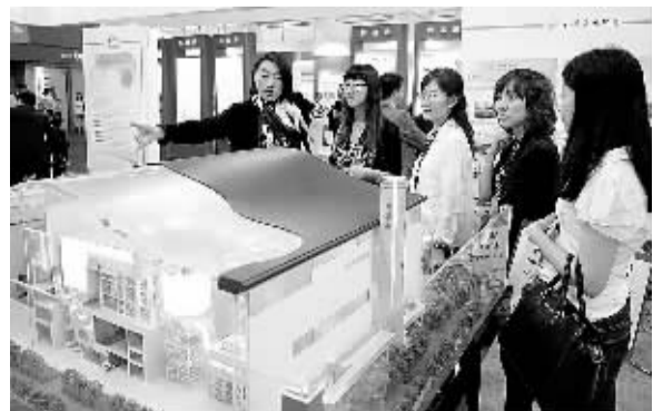
10月29日，观众在展会现场观看垃圾焚烧处理模型。当天，第九届香港国际环保博览会在香港亚洲博览馆开幕，展会内容涉及废物处理及循环再造、绿色建筑等领域。

通知明确，要定期组织对达标煤矿进行抽查，推动煤矿安全质量标准化动态达标。省、市(地)两级煤矿安全质量标准化工作主管部门每年要分别按照不低于10%和20%的比例进行达标抽查，并督促煤矿上级公司每季度进行一次达标动态检查，煤矿每月进行一次达标自查。在抽查过程中发现有弄虚作假的，视情节轻重给予降级或取消等级处罚，并予以通报。对因发生事故、管理滑坡等原因被取消等级或降级的原二级、三级标准化煤矿，省级煤矿安全质量标准化工作主管部门要予以公布。