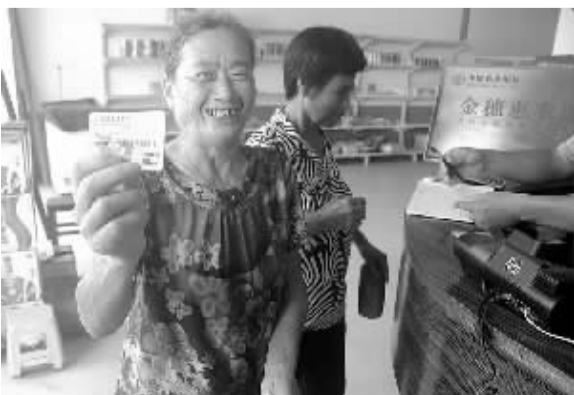
中国农业银行江西省分行积极推进农村普惠金融建设,在农家店、小超市、卫生所等场所设立服务点,让农民足不出村就能享受金融服务。图为江西贵溪市雷溪乡一位村民在展示当地农发行发放的“金穗惠农卡”。

为提高员工对绿色信贷的认识,交行上海市分行积极组织员工参加绿色信贷相关培训,引导员工熟练掌握节能减排项目判断依据、节能减排量测算等。根据交通银行对行业绿色信贷指引的有关要求,交行上海市分行已分别从耗能、污染、生态保护、气候时代等多个方面,对传统授信业务和新兴非信贷业务的客户环境和社会表现进行了评估和监测,进一步提高环境和社会风险的防范能力,“绿色理念”已在全行生根发芽。