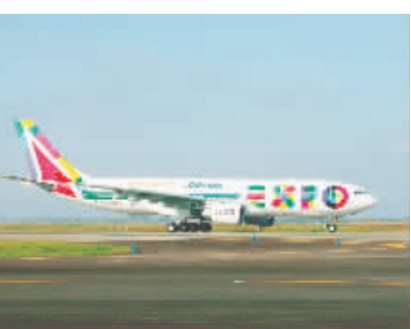
当地时间10月20日中午12点30分,一架与阿提哈德航空相同的意大利航空“2015米兰世博号”空客A330-200专属涂装飞机降落在意大利米兰马尔彭萨机场。

“英特尔投资中国智能设备创新基金”是英特尔投资今年4月在中国设立的第三只基金,总金额为1亿美元,旨在为包括平板电脑、智能手机、PC、2合1设备、可穿戴设备和物联网解决方案等相关领域的创业公司提供所需资金,帮助他们在英特尔技术平台上开展创新。另两只基金分别为2005年设立的总金额为2亿美元的“英特尔投资中国技术基金”以及2008年设立的总金额为5亿美元的“英特尔投资中国技术基金II”。