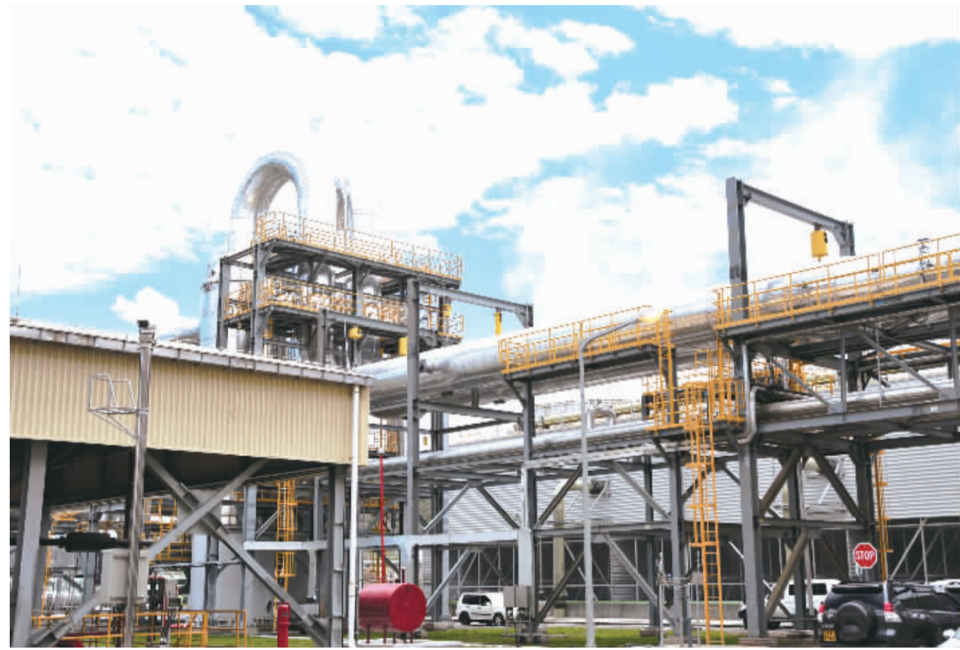
由中国公司参与建造的肯尼亚“奥卡瑞”四号地热电站项目日前在内罗毕举行启动仪式。该电站是目前世界上单体发电量最大的地热电站。图为在肯尼亚首都内罗毕西南约90公里的奈瓦沙地区拍摄的奥尔卡里亚地热发电项目四期电站。

谈及中国提出的“一带一路”战略构想,贺国健表示,阿联酋正好位于丝绸之路之上,“一带一路”建设为阿提哈德航空开拓中国市场提供了更好的机会。阿提哈德航空非常重视中国市场,我们将致力于强化现有航线的服务和产品,同时主动与中国航空公司沟通,进一步推进现有合作。贺国健表示:“我们希望与中国航空公司展开全方位合作,未来还可在飞行员及空乘人员培训、旅游推广等领域加强合作。希望通过我们的服务,让乘客更加方便地前往阿布扎比,以及海合会国家、中东、北非和欧洲的主要城市。”