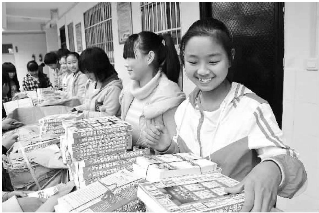
10月21日，汝阳县新村乡初级中学的学生喜领新书。当日，团中央中国青年发展服务中心携手金星国际教育集团在河南省汝阳县新村乡初级中学举行“手拉手”金星书屋建设活动捐赠仪式，向新村乡初级中学捐赠价值10万元的图书。