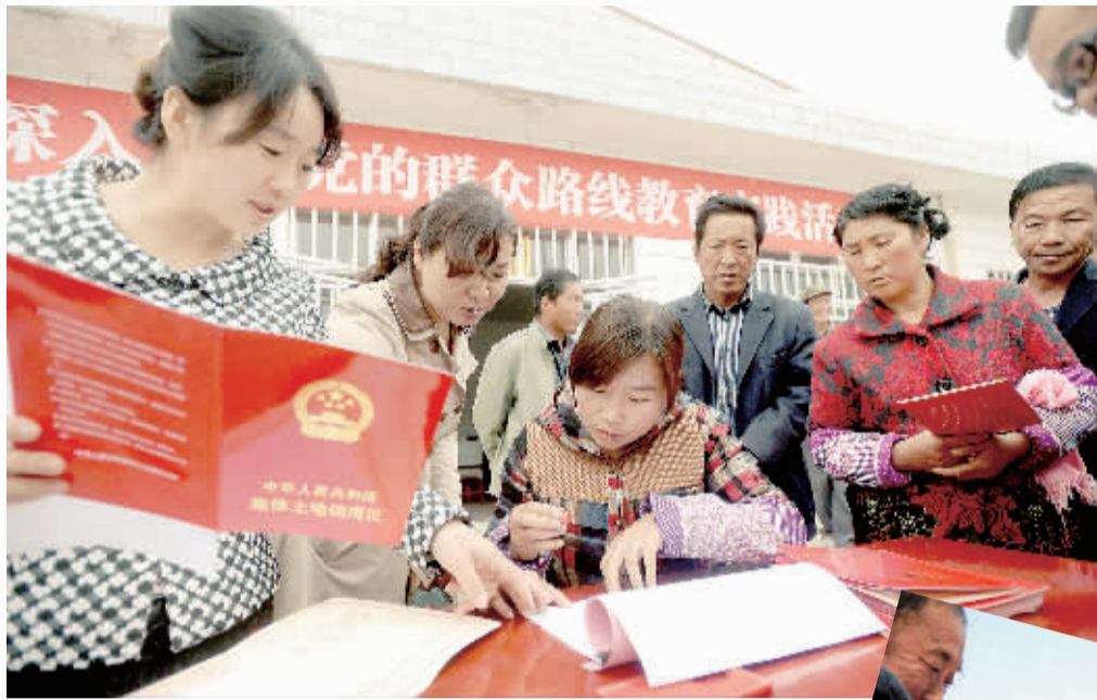
左图 甘肃临泽县倪家营乡梨园村村民在村委会领取宅基地使用证书。