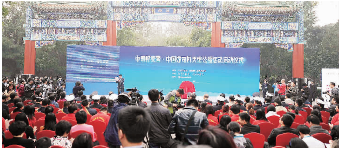
10月10日,由中央文明办、公安部、交通运输部指导,经济日报社、人民公安报社主办,东风汽车公司协办的“中国好交警·中国好司机”大型公益活动在京正式启动。图为活动启动仪式现场。

本报北京10月10日讯 记者王晋报道:“中国好交警·中国好司机”大型公益活动今天在京正式启动。该活动由中央文明办、公安部、交通运输部指导,经济日报社、人民公安报社主办,东风汽车公司协办,将于即日起至12月在北京、成都、广州、南京、武汉等重点城市集中开展推广活动,并在《经济日报》、《人民公安报》及中国经济网、经济日报法人微博、微信、新闻客户端等持续开展线上宣传活动。 这项大型公益活动通过在全国范围内寻找、发现、推介、宣传有代表性的好交警、好司机,展示交警、司机群体的工作生活和风采风貌;通过对道路交通安全法规知识和