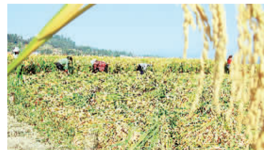
10月10日,在湖南省溆浦县横板桥乡红星村,工作人员在收割超级杂交稻。

本报北京10月10日讯 记者乔金亮报道:农业部今天宣布,今天组织专家对由袁隆平院士领衔的第四期中国超级稻亩产1000公斤攻关项目进行测产,结果显示,湖南省溆浦县第四期超级稻亩产超过1000公斤,创造了1026.7公斤的新纪录。 从2000年第一期目标的亩产700公斤,2004年第二期的亩产800公斤、2011年第三期的亩产926.6公斤,到2014年的亩产1026.70公斤,我国杂交水稻育种研究在14年里取得了令世界瞩目的“四连跳”。