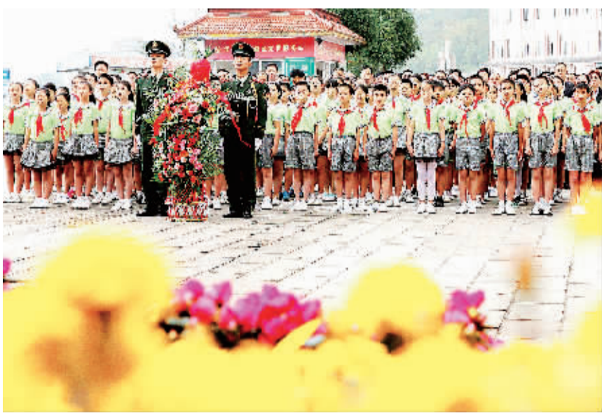
9月30日，是国家首个烈士纪念日。四川华蓥市广大干部群众及社会各界在华蓥山游击队纪念馆前举行公祭烈士活动，缅怀和祭奠英烈。

念142名为国捐躯的革命先烈们。手执鲜花的官兵们在纪念碑和烈士陵墓前脱帽、肃立、默哀，向英勇牺牲在抗日前线和对越自卫反击战中的革命烈士们鞠躬致敬，官兵们庄严地举起右手，用铮铮誓言告慰烈士，坚决继承为党、为国、为人民，不惜牺牲生命保家卫国的崇高遗志。