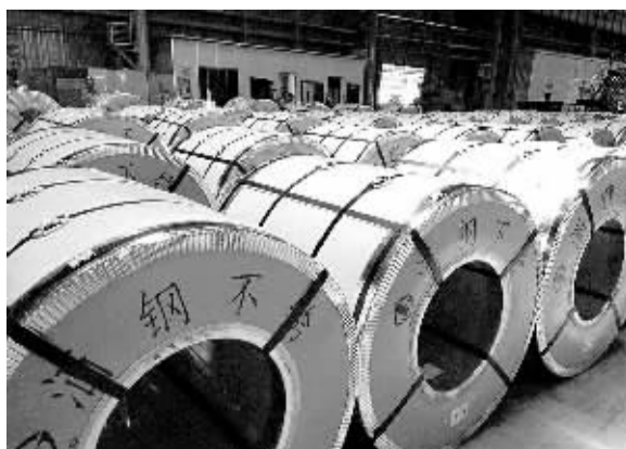
酒钢集团不锈钢生产车间内“整装待发”的不锈钢板材。

产业融合是同一技术向不同产业扩散而推动产业间的协同发展。产业耦合不仅是不同产业间技术、知识上的共享和相融,更是市场、生产要素、产品研发、技术创新等全方位的合作利用和交互影响。耦合产业的边界并没有因为技术的渗透而模糊甚至消除,耦合产业仍然保持各自的独立性。用耦合理论阐释当前产业经济,主要是因为产业耦合是一种更为全面、更为高效的先进产业发展模式,具有发展成本更低、发展机制灵活、产业结构合理三大优势,适应我国当前产业结构调整 and 转型升级的需要。(李景)