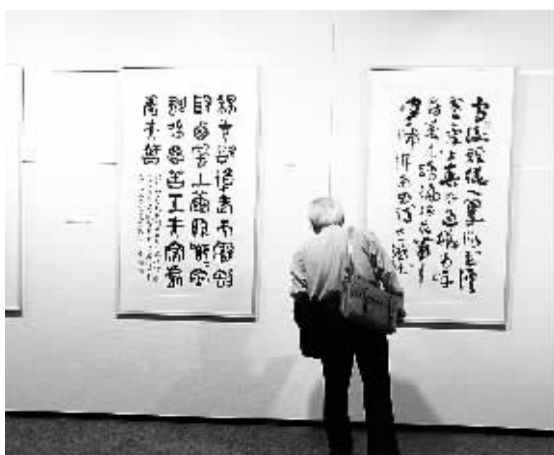
“现代中国·国画展——写意画与齐白石和他的弟子们”日前在东京开幕,展览正值中国艺术家齐白石诞辰150周年,共展出“齐派”名家作品200余件。图为参观者在观看“齐派”篆刻书法。

本报讯 记者陈颖报道:位于美国中南部的达拉斯·沃斯堡国际机场代表团日前访问中国,为美国航空最近开通达拉斯·沃斯堡—上海和达拉斯·沃斯堡—香港直航航线做准备,扩大北德州与中国的商业往来。达拉斯·沃斯堡机场首席执行官官诺辉说,达拉斯·沃斯堡—中国直航航线的开通,为亚洲的商务和休闲旅行以及货物运输提供了机会。 据悉,达拉斯·沃斯堡总贸易量的近40%来自中国,中国是该地区第一大贸易伙伴,贸易量约为每年270亿美元。达拉斯·沃斯堡机场已与上海机场集团建立了姐妹机场合作关系,近期还将与北京首都国际机场签署战略合作协议。