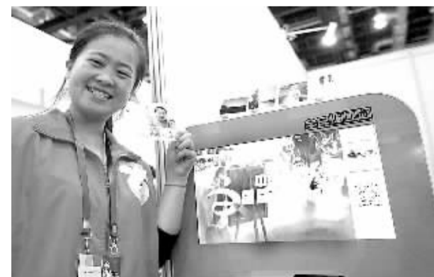
9月28日,北京文化数码博览会上,工作人员向观众介绍微信打印机。此次博览会集中展示教育、商务、通讯等领域的前沿科技产品。