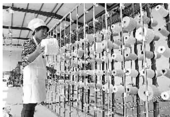
9月24日,工人在河北冀州一家生产手织粗布产品的公司车间内忙碌。近年来,河北省冀州市大力发展纯棉手织粗布产业,先后出现多家企业,周边市县的1200余个加工户致富。

《制度》明确了督办的适用范围,即国家邮政局对违反邮政行业法律、法规、规章等有关规定,严重损害消费者权益、严重扰乱邮政市场秩序或造成重大社会影响的违法案件,提出明确要求,督促相应省(区、市)邮政管理局办理。国家邮政局负责督办的重大违法案件主要包括:在全国或者省(区、市)范围内有重大影响的案件;涉及金额较大、情节特别严重的案件;国务院、交通运输部等上级机关、上级领导交办的案件;需要督办的其他案件。《制度》规定,在国家级媒体上曝光而当地邮政管理部门未及时发现查处的违法案件,原则上应当实行督办。