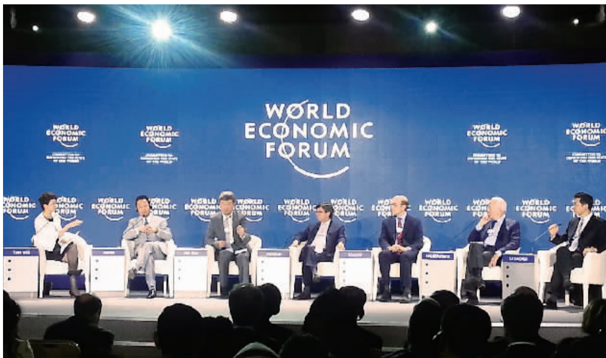
图为9月10日举行的2014夏季达沃斯论坛“全球经济最新动态”分论坛现场。当日,2014夏季达沃斯论坛在天津开幕。本报记者 张小影摄 (达沃斯论坛特刊见13版至15版)

贸易试验区等问题。 世界经济论坛主席施瓦布、马里总统凯塔、塞尔维亚总理武契奇、阿尔巴尼亚总理拉马、丹麦首相托宁-施密特等各国政要以及来自世界90多个国家和地区各界代表2100多人出席会议。 中共中央政治局委员、天津市委书记孙春兰,中共中央书记处书记、国务委员兼国务院秘书长杨晶出席。 (致辞全文见三版)