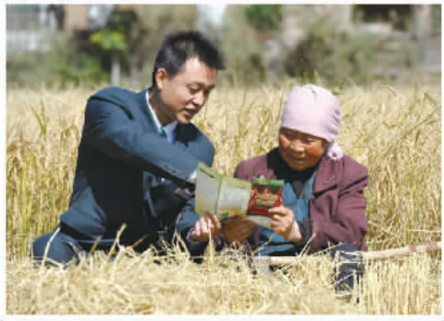
在宁夏田间地头向农民客户介绍保险产品