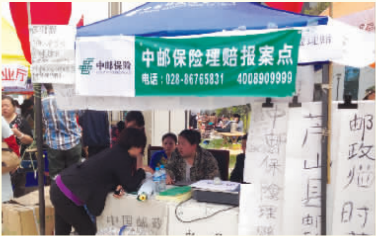
芦山地震1小时18分后率先设立灾区保险理赔服务点

持续优化资本运营环境。中邮保险建立与公司业务规模、分支机构扩展、资产负债匹配策略相适应的资本补充管理机制，五年来偿付