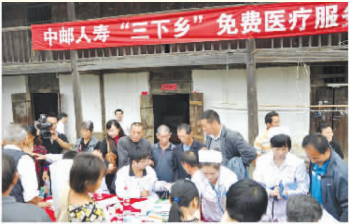
在江西永修县柘林镇司马村免费为村民体检

筚路蓝缕，玉汝于成。 2014年9月9日，中邮人寿保险股份有限公司成立五周年。 五年前，中邮保险孕育而生，犹如一缕生机盎然的燎原星火。 五年来，中邮保险风雨兼程，绘就一幅绚丽磅礴的精彩华章。 回首中邮保险五年的光辉历程，每一步都走得坚实而笃定。从“服务基层、服务三农”的责任定位，到“低成本、广覆盖、高产出”的发展理念；从“看得懂、买得起、用得着”的产品体系，到“信送到哪里，中邮保险就到哪里”的服务承诺；从“专业化与特色化并举”的发展原则，到“加速价值成长”的转型布局。这五年，是传承百年邮政、勇担社会责任的奉献五年，是发挥特色优势、开创发展奇迹的拼搏五年，是追求价值成长、深化转型升级的创新五年。这是一条光荣之路，也是一条艰辛之路，更是一条希望之路。