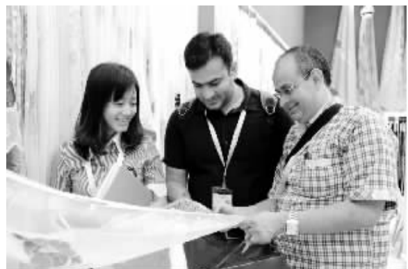
埃及客商在浙江海宁展位洽谈窗帘面料业务。日前,中国国际家用纺织品及辅料(秋冬)博览会在上海拉开帷幕,来自31个国家和地区的近1400家企业,向国内外来宾展示家纺企业最新研发的绿色环保新产品、顶尖技术。

时间不要过。国家工商总局外资注册局局长马夫表示,根据《企业信息公示暂行条例》,企业应当于每年1月1日至6月30日,向工商部门报告上一年度年度报告,并通过企业信用信息公示系统向社会公示;应当自即时信息形成之日起20个工作日内向社会公示。