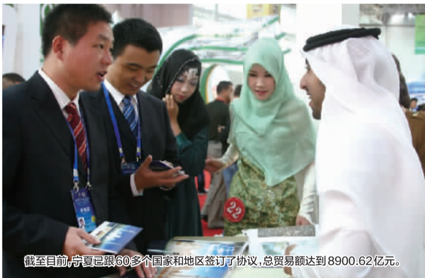
截至目前,宁夏已跟60多个国家和地区签订了协议,总贸易额达到8900.62亿元。

宁夏回族自治区与阿拉伯国家文化习俗相近,这将拉近宁夏与阿拉伯国家的关系,特别是以教育为支撑,推进与阿拉伯国家的交往,其