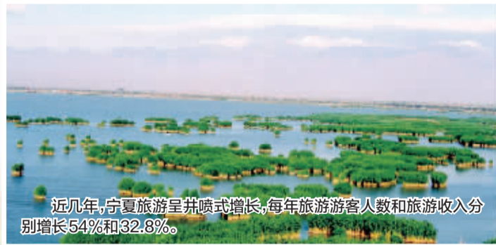
近几年,宁夏旅游呈井喷式增长,每年旅游游客人数和旅游收入分别增长54%和32.8%。

宁夏回族自治区有两张亮丽的名片,一张是民族团结的名片,一张是生态环境的名片,在建设丝绸之路经济带框架下,宁夏回族自治区决意把这两张名片打造得更亮丽。一方面继续推进民族团结进步创建,依法管理宗教事务,寓管理于服务做好宗教工作,进一步巩固和发展民族团结、宗教和睦、社会和谐稳定的生动局面;另一方面坚持不懈地抓好生态建设,努力建设美丽宁夏。要把宁夏回族自治区的投资发展环境打造成为西部最优,使宁夏成为投资发展洼地、企业发展福地、干事创业基地。在西部最优,就是转变政府职能,进一步简政放权,提高效能;就是发挥宁夏人包容、热情、真诚、质朴的品质,打造诚实守信的人文环境。通过优美的自然环境、良好的人文环境和投资环境,吸引更多客商来宁投资。