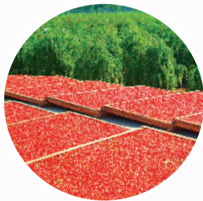
世界枸杞在中国,中国枸杞在宁夏。截至目前,宁夏枸杞产量达到50多万亩,6大类几十个深加工产品畅销东南亚、欧美等20多个国家和地区。

宁夏回族自治区旅游资源丰富,黄河文明、西夏历史、回乡风情、大漠风光吸引着越来越多的中外游客。宁夏回族自治区将牢固树立大旅游理念,积极引导国内外大型旅游集团,开发一批精品旅游景点、精品旅游线路,努力把宁夏回族自治区打造成为独具特色的西部国际旅游目的地。