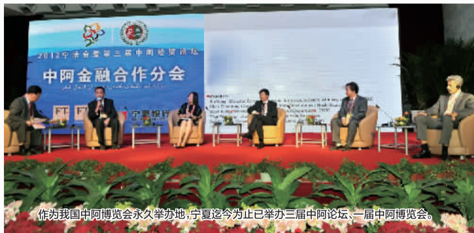
作为我国中阿博览会永久举办地,宁夏迄今为止已举办三届中阿论坛、一届中阿博览会。

古丝绸之路,穿越两千多年时空,横跨亚欧15国,全长8000多公里,中国境内有4000多公里,沟通了亚、欧、非不同文明、不同民族之间的交流与往来,成为东西方文化贸易的大通道。