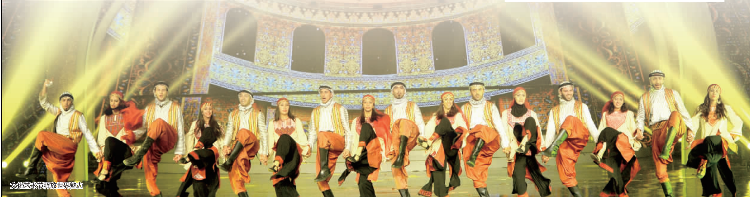
文化艺术释放世界魅力