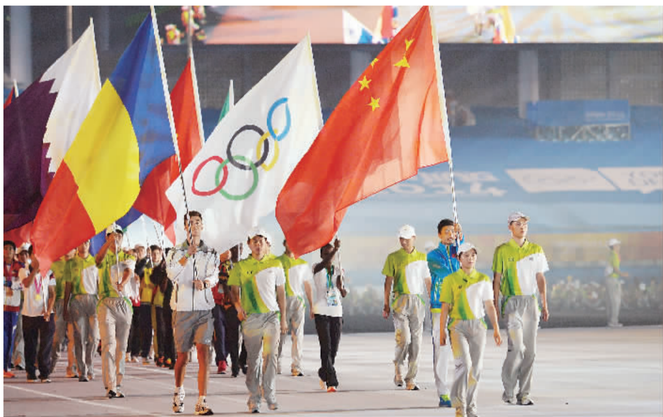
8月28日，第二届夏季青奥会闭幕式在南京奥林匹克中心体育场举行。图为各国代表团旗帜入场。