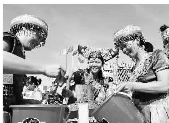
8月27日，广西壮族自治区容县经济开发区内，挑战者们在比赛研磨黑芝麻。近年来，容县黑芝麻产业迅速发展，全县将打造年收入50亿元的黑芝麻产业链。

检查内容主要包括，检查各机构资质及资质证书使用情况，是否存在伪造、变造、转让或者租借资质证书，超出资质证书业务范围从事技术服务活动等。