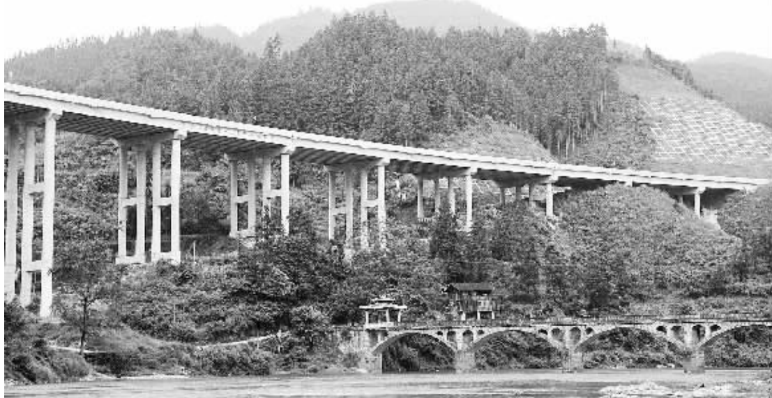
这是三黎高速12标段的归德大桥(8月26日摄)。近日，连接贵州省三穗县和黎平县的三黎高速路基土建工程施工接近尾声，路面、交安、绿化等工程全面铺开，预计今年年底全线通车。

检验检疫部门依法对所有发现问题的不合格进口产品进行了处理，并约谈了部分产品的进口商、品牌商或代理商，要求其向我国出口产品时，要严格遵守我国技术规范的强制性要求，对于反复出现质量安全问题的产品，质检总局将采取严厉的处理措施。