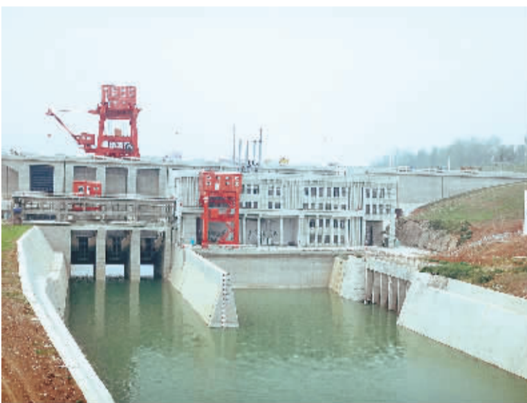
图为南水北调中线陶岔渠首部枢纽工程。