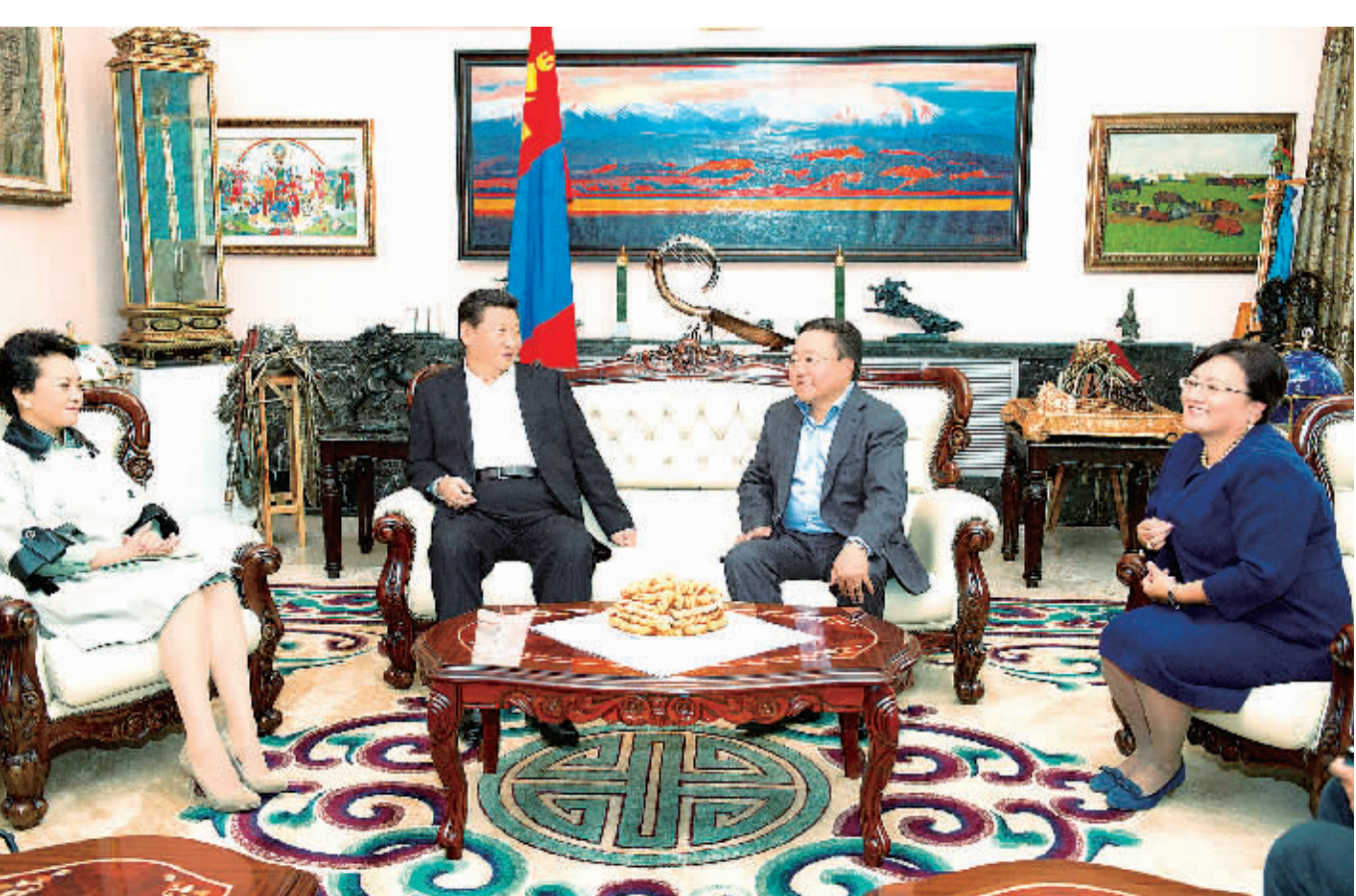
8月22日, 国家主席习近平同蒙古国总统额勒贝格道尔吉在乌兰巴托市郊的总统官邸再次会晤。

额勒贝格道尔吉表示, 习近平主席这次访问取得重要成果, 是一次名符其实的历史性访问。我们谈得很好、很深入。同您在一起我感到很亲近, 给我留下美好深刻的印象。我珍惜我们之间兄弟般的情谊, 愿同您携手努力, 深化双方合作, 使蒙中全面战略伙伴关系更好造福两国人民。