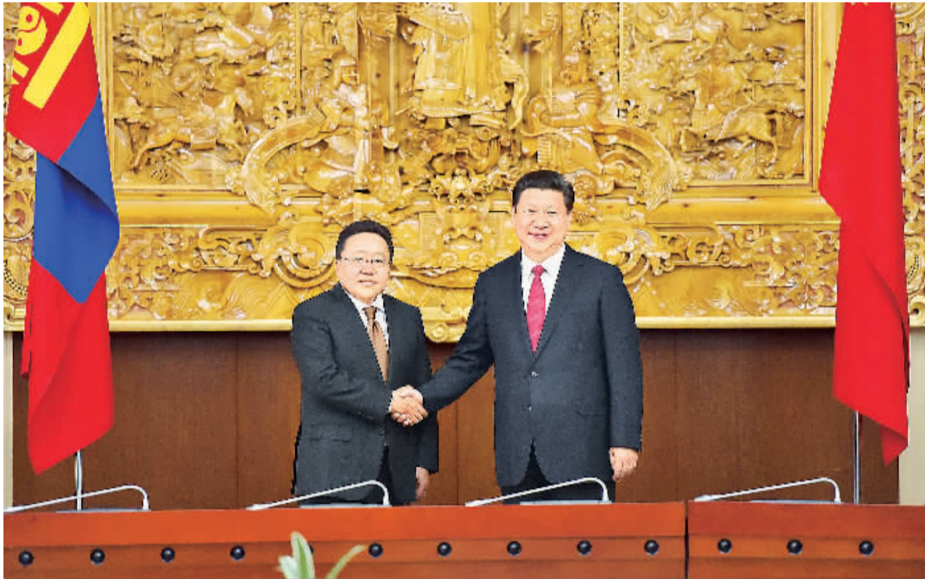
8月21日,国家主席习近平在乌兰巴托同蒙古国总统额勒贝格道尔吉举行会谈。

习近平指出,中蒙建交65年来,友好和合作是两国关系主流。双方都真诚尊重对方根据自身国情选择的政治制度和发展道路,都真诚照顾彼此核心利益和重大关切,都真诚视对方发展为自身发展的重要机遇,推动中蒙关系不断得到新发展。这一局面来之不易,值得珍惜。中方愿意同蒙方增进睦邻互信,深化互利合作,实现共同发展繁荣。这次双方决定将两国关系提升为全面战略伙