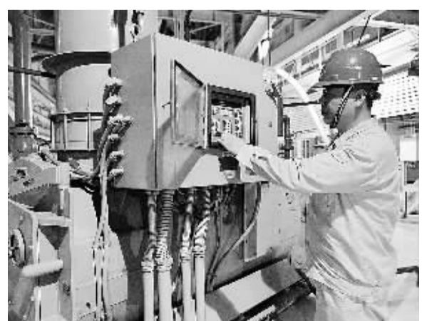
8月19日，工作人员在国华三河电厂1号机组检修维护运行设备。日前，该项目通过项目验收并实现投产，成为京津冀首台达到燃气机组排放标准的“近零排放”燃煤机组。

海关总署新闻发言人张广志透露，海关总署将联合国家邮政管理部门共同打击邮递、快件渠道进出口侵权违法行为，同时继续加强与公安、工商等部门的合作，强化源头治理。海关将加大与大型电子商务平台企业的合作力度，及时获取相关商品及交易信息，提高打击侵权违法的精准度。