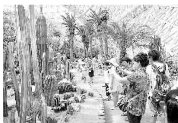
随着山东青岛海滨旅游旺季的到来和青岛国际啤酒节、海洋节的同期举办,2014青岛世界园艺博览会游客接待量连日增长。图为近日,游客在青岛世园会植物馆内参观。