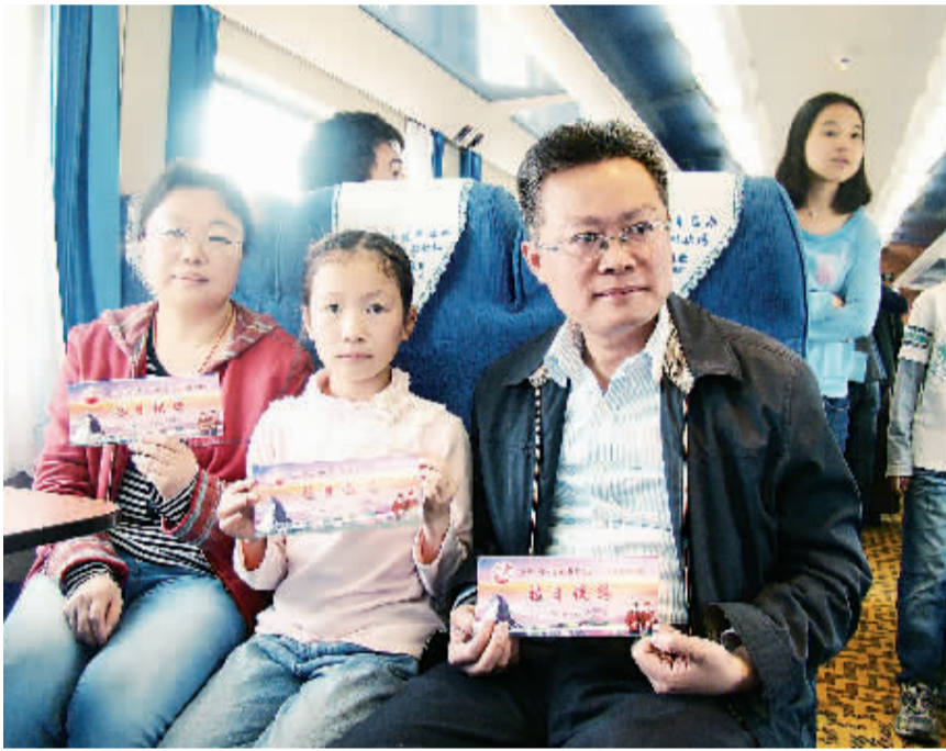
图为拉日铁路首列上的一家人。

青藏铁路路网的逐渐完善还将促进西藏对外贸易稳步增长。统计显示，西藏自治区陆路边境线4000多公