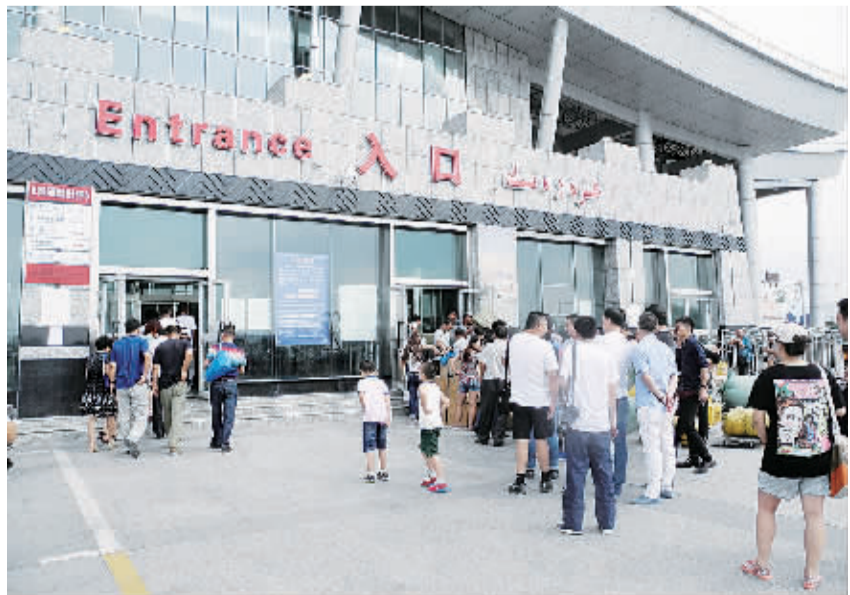
8月15日，在中哈霍尔果斯国际边境合作中心入口处，办理运货手续的队伍很长。

8月15日中午，中哈霍尔果斯国际边境合作中心入口处，手提肩扛的人群熙熙攘攘，不断涌入通关大厅。运货通道的队伍也排得很长，大包小包塞得满满当当。对于个人来说，进入合作中心非常简