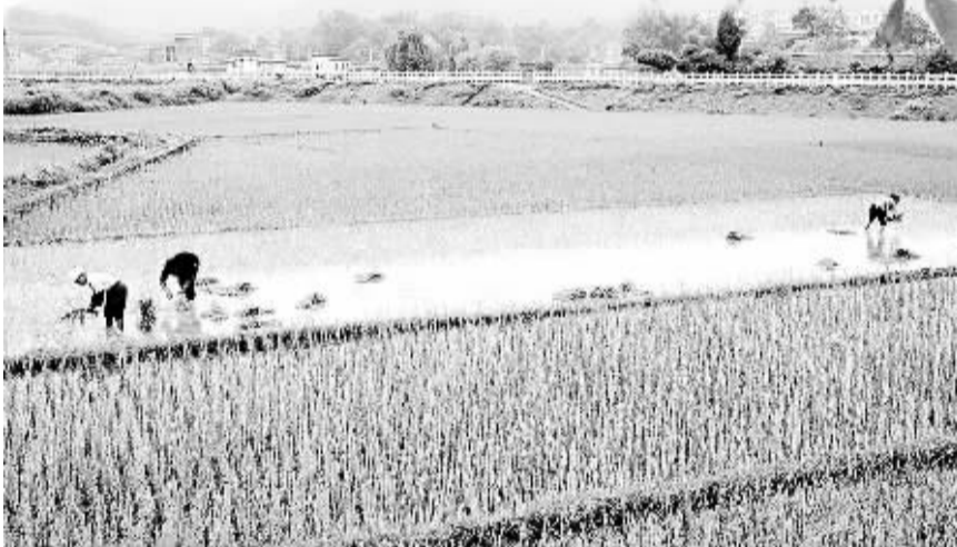
8月14日，广西来宾市忻城县城关镇都乐村的农民在田间抢种晚稻。广西农民抢抓时机对农作物施肥打药、除草补苗，确保秋粮丰收。

诉记者，我国每年都有干旱发生，全国粮食播种面积常年稳定在16亿亩以上，今年旱灾面积约为6000多万亩。虽然局部若干区域旱情较严重，但整体来看，受灾地区比重较往年相比仍较低，全国秋粮总体长势乐观。