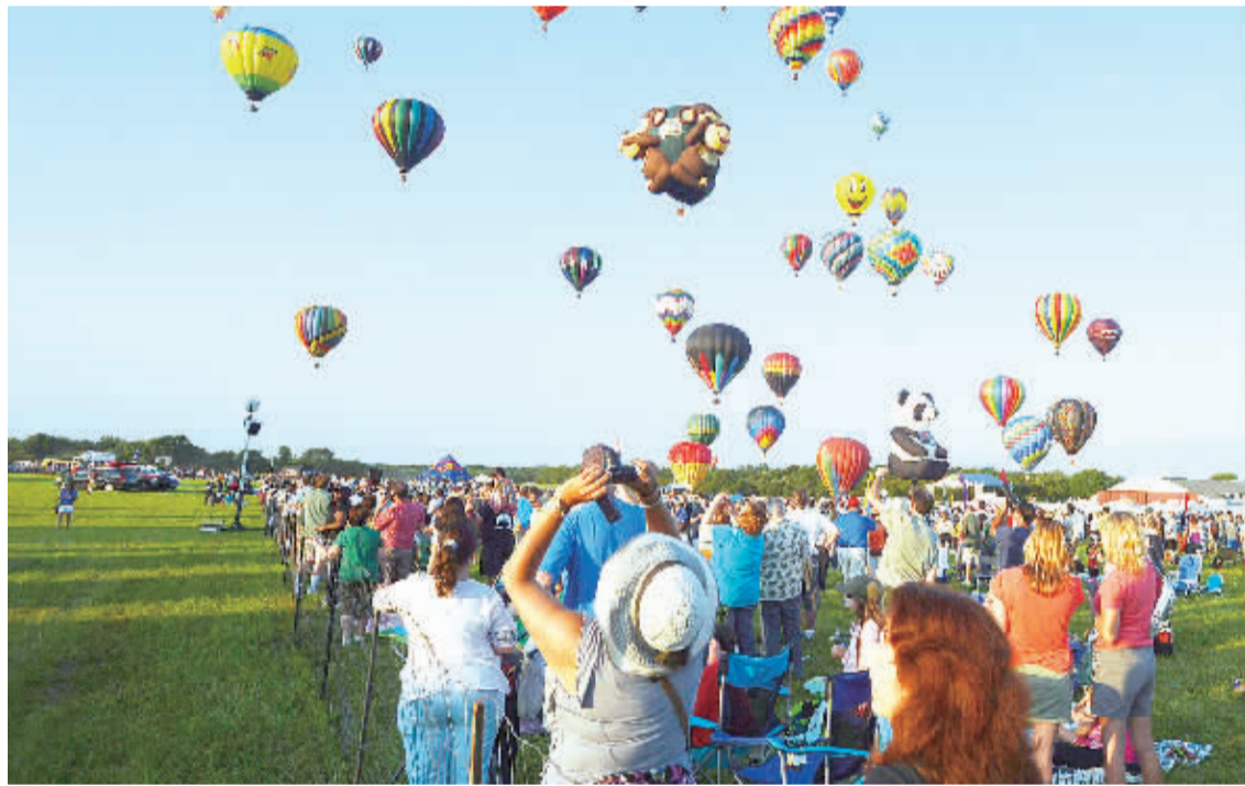
在美国新泽西州雷丁顿,人们观看热气球升空。第32届新泽西热气球节日前在雷丁顿举行。数十个造型各异的大型热气球同时升空,吸引了数万民众观看欣赏。

报告认为,如果非洲国家不优先投资儿童,在接下来的数十年,非洲大陆将无法利用人口转型的优势;如果不能落实关注儿童平等的包容性政策,非洲人口的快速增长将阻碍相关国家消除贫困的进程。