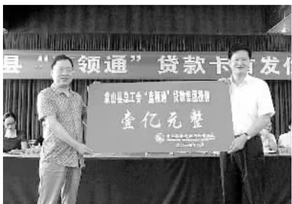
为加大对工会会员的信贷支持力度，浙江省象山县农信联社日前在全国首推“蓝领通”贷款卡产品，向工会集团授信1亿元，并同时建立沟通管理机制进行贷款审核，为工会会员申请贷款提供便利。图为“蓝领通”贷款卡首发仪式现场。

同时，合作社以“担保公司”的形式出现，社员将房产、大棚、农机、麻鸡、黄花菜等抵押在合作社，合作社对社员的信用度、还贷能力进行把关，直接推荐其向金融机构贷款，方便又快捷。合作社社员若有贷款需求，只需向合作社提出申请，经调查、审核，就能轻松领到5万元至10万元小额贷款，循环使用、随借随还。今年以来，已有4000余名社员向金融机构贷款，总额近亿元。