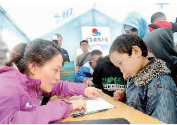
8月11日，鲁甸地震灾区龙头山镇抗震希望小学学生正在板房教室前领取助学金。当日，中国青少年发展基金会为该所学校300名受灾学生发放30万元助学金，并为每名学生送来书包文具。(抗震救灾特别报道见四版)