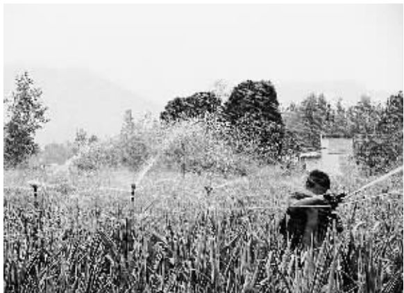
8月3日，河南省方城县古店乡农民正在采取喷灌的办法抗旱保秋。

通知要求，近3年平均孕产妇死亡率、婴儿死亡率和5岁以下儿童死亡率应低于同年度、同地区平均水平，针对主要死亡原因实施有效干预；孕产妇住院分娩率达到98%以上，孕产妇系统管理率达到85%以上，3岁以下儿童系统管理率和7岁以下儿童健康管理率达到80%以上；5岁以下儿童生长迟缓率、低体重率、贫血患病率分别控制在7%、5%和12%以下。