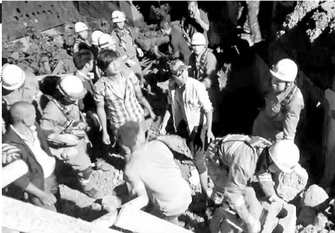
8月3日，救援人员在云南鲁甸县地震现场开展救援工作（手机拍摄）。