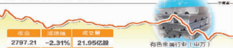
8月1日波动最大行业走势图

全国股转系统力争8月底推出做市业务 8月1日召开的中国证监会例行新闻发布会透露,全国股份转让系统将于本周末启动做市业务第一轮全面试点,力争8月底按计划推出做市业务 截至7月30日,46家主办券商已经获得做市业务备案