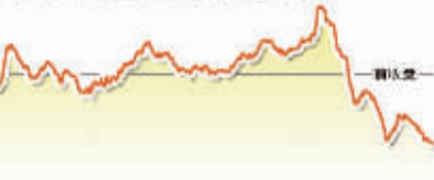
8月1日上证综指走势图