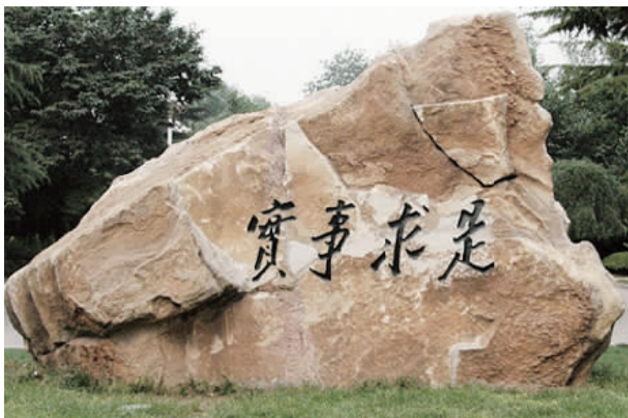
人大校训：实事求是。