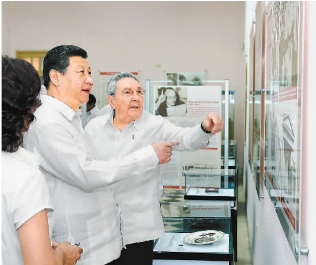
这是习近平和劳尔·卡斯特罗在蒙卡达兵营旧址