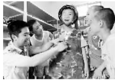
上图 山东无棣县边防大队举行警营开放日,辖区留守儿童在这里亲身感受警营生活。

右图 江西省峡江县,科普大篷车开进青少年活动中心,通过车载的科普实物展品,激发青少年学习科学的热情。