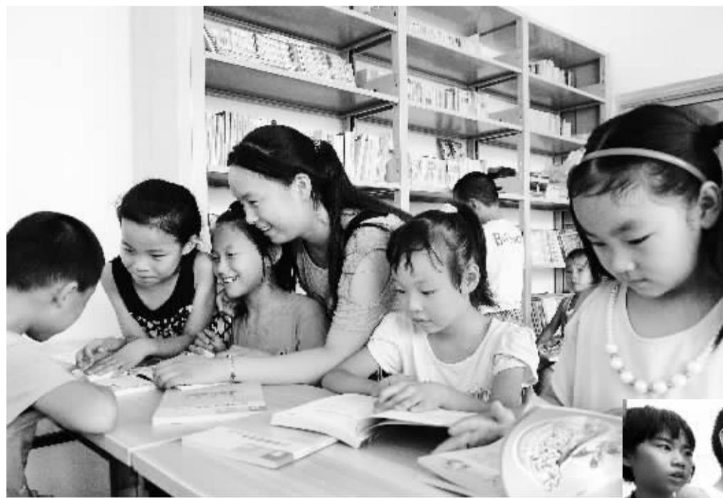
暑假期间,各地通过举办各种文化活动,丰富孩子们的假期生活。