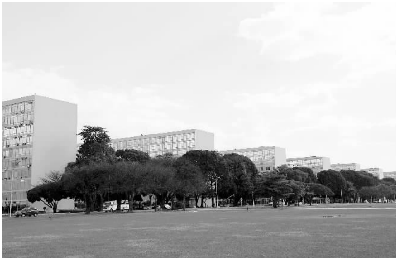
在巴西利亚部委行政区内,政府各部委的大楼沿着城市主干道整齐排列