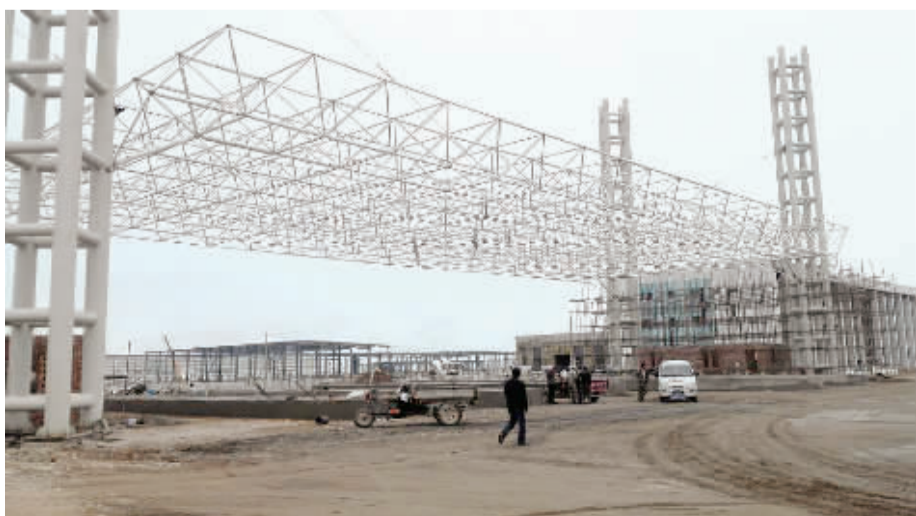
武威保税物流中心占地734亩，总建筑面积将达到5.58万平方米。目前建筑工人正在紧张施工。

从“设想”到“落地”并非易事。为搞明白何为“保税物流”，武威全市上下多次组织讲座、培训，认真梳理了武威在新一轮向西开放、转型发展中的功能定位、发展路径等。武威市招商局副局长赵经洲坦言，过去武威“想不到”也“不敢想”保税物流中心，深入分析后才发现，武威在外