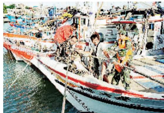
7月22日，边防官兵在福州连江县黄岐中心渔港帮助台胞加固渔船。