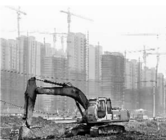
6月份，70个大中城市中仅有8个城市房价环比上涨。图为上海市宝山区的一处在建商品房住宅小区。

“在行业的优胜劣汰中，中国楼市将不断走向成熟发展的新阶段。而企业间互相竞争带来的压力和常态化调整，将促进房地产市场的优化和最终进步。”秦虹说。她最近在接受采访时还直言：“地方政府吃土地饭吃得太舒服了，所以就离不开了，所以老要刺激土地。这给房地产市场带来的后期风险是非常大的。大城市地价越卖越贵，中小城市卖不了那么贵的地，就越卖越多。从体制上还期待尽快改革，因为这不可持久！”