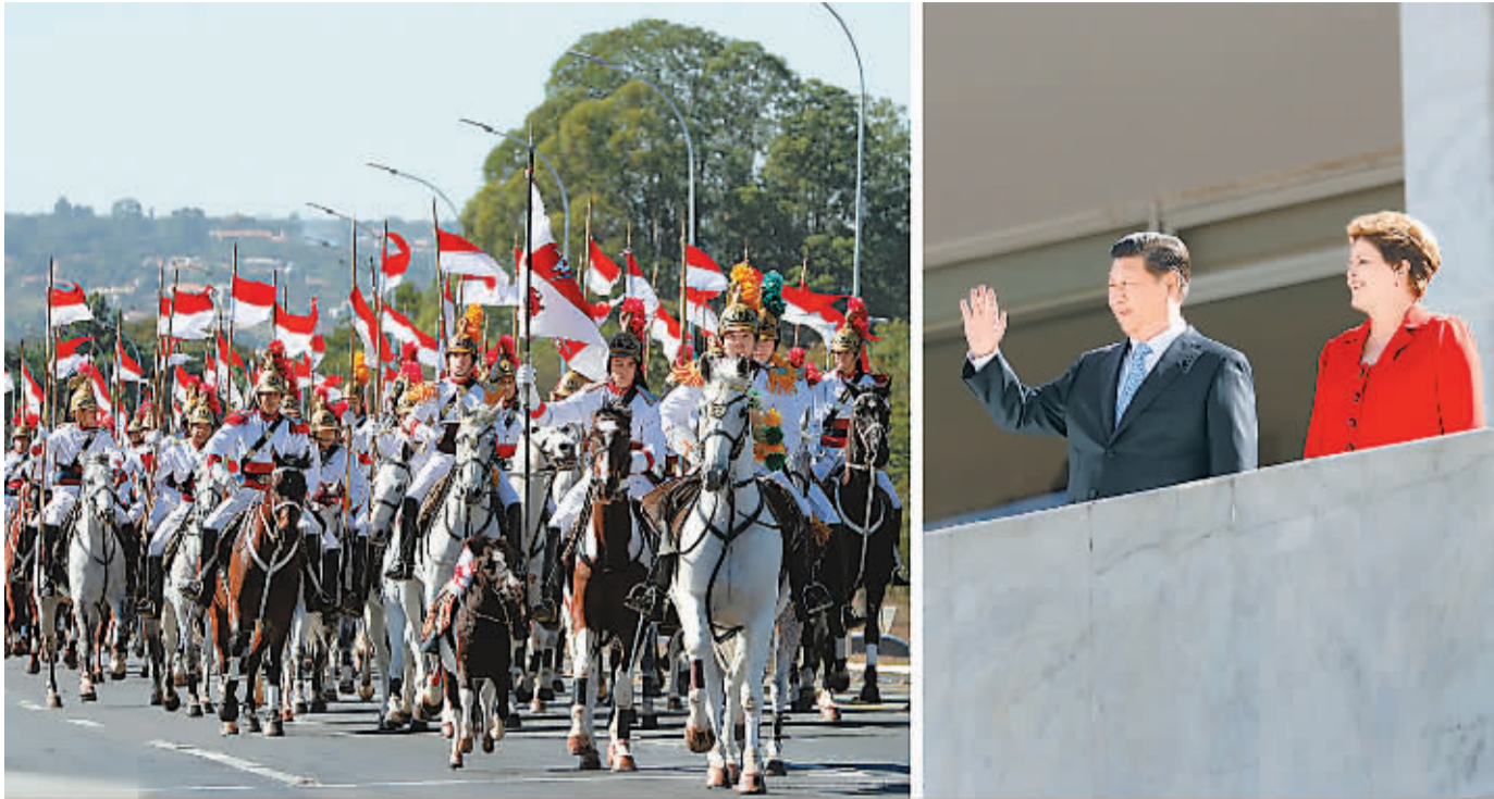
当地时间7月17日，国家主席习近平在巴西利亚出席巴西总统罗塞夫举行的欢迎仪式(拼版照片)。