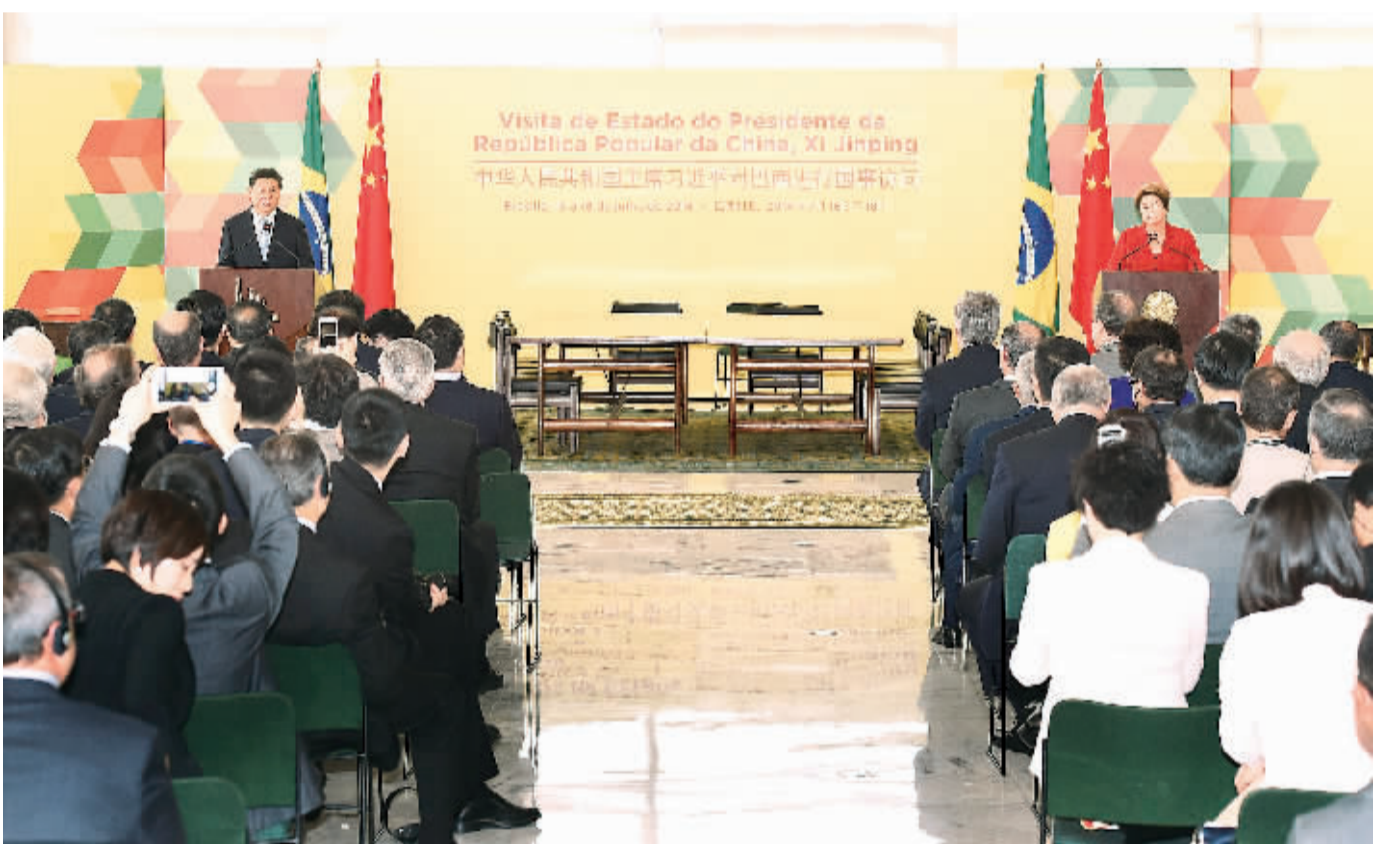
当地时间7月17日，国家主席习近平在巴西利亚同巴西总统罗塞夫举行会谈。这是会谈后，两国元首共同会见记者。