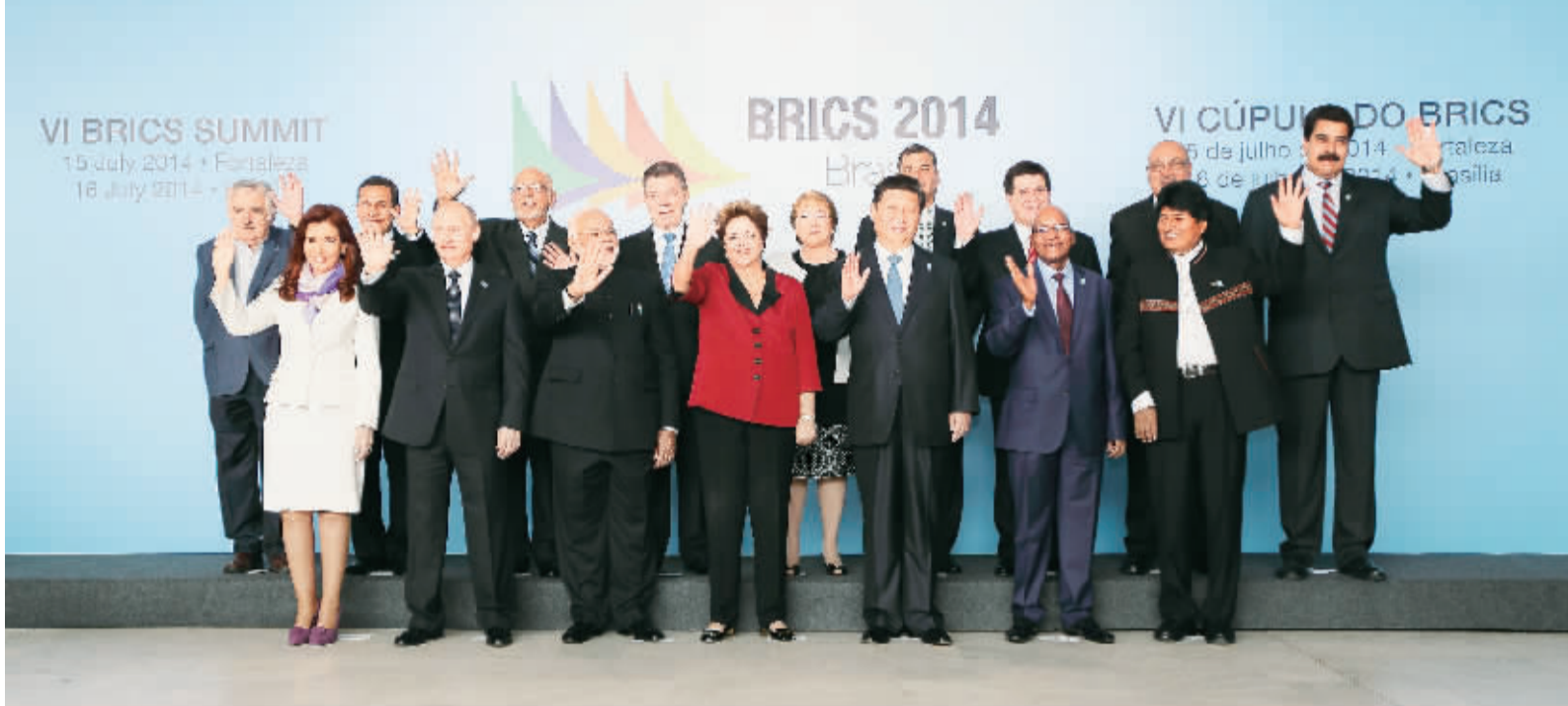
7月16日,国家主席习近平出席在巴西利亚举行的金砖国家同南美国家领导人对话会。这是与会各国领导人在会前集体合影。

本报巴西利亚7月16日电 记者王宝钺报道:7月16日,金砖国家同南美国家领导人对话会在巴西利亚举行。中国国家主席习近平、巴西总统罗塞夫、俄罗斯总统普京、印度总理莫迪、南非总统祖马以及苏里南总统鲍特塞、阿根廷总统克里斯蒂娜、玻利维亚总统莫拉莱斯、哥伦比亚总统桑托斯、智利总统巴切莱特、厄瓜多尔总统科雷亚、圭亚那总统拉莫塔尔、巴拉圭总统卡特斯、秘鲁总统乌马拉、乌拉圭总统穆希卡、委内瑞拉总统马杜罗等南美国家领导人共同出席。