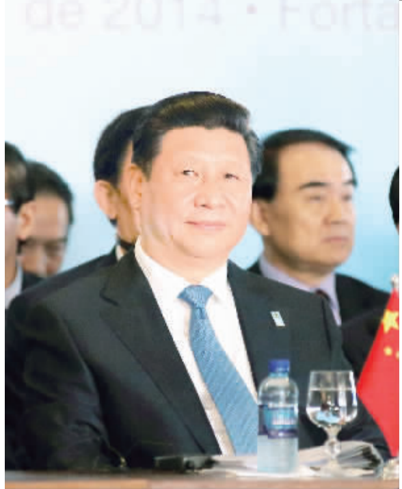
7月16日,国家主席习近平出席在巴西利亚举行的金砖国家同南美国家领导人对话会。