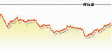
上证综指 收盘 2055.59 成交量 104.49亿股