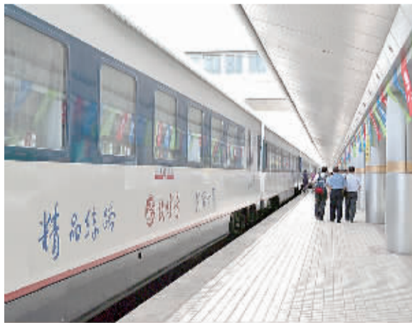
“敦煌号”列车整装待发。

“‘敦煌号’不仅是一趟列车,更是甘肃的一张名片。”兰州铁路局宣传部部长左德敏认为,随着新丝绸之路经济带的建设和甘肃省积极打造敦煌国际文化旅游名城,敦煌将更受关注,“敦煌号”将会吸引更多的游客前往敦煌,推动敦煌经济发展,也将大大提升甘肃旅游的整体形象。