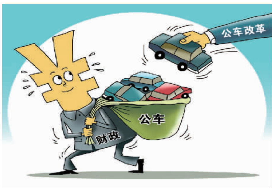
减负 朱慧卿作

对参改的司局级及以下工作人员适度发放公务交通补贴,司局级每人每月1300元、处级每人每月800元、科级及以下每人每月500元