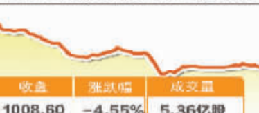
7月16日波动最大行业走势图