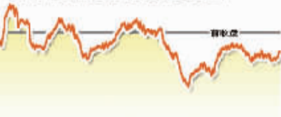
7月16日上证综指走势图