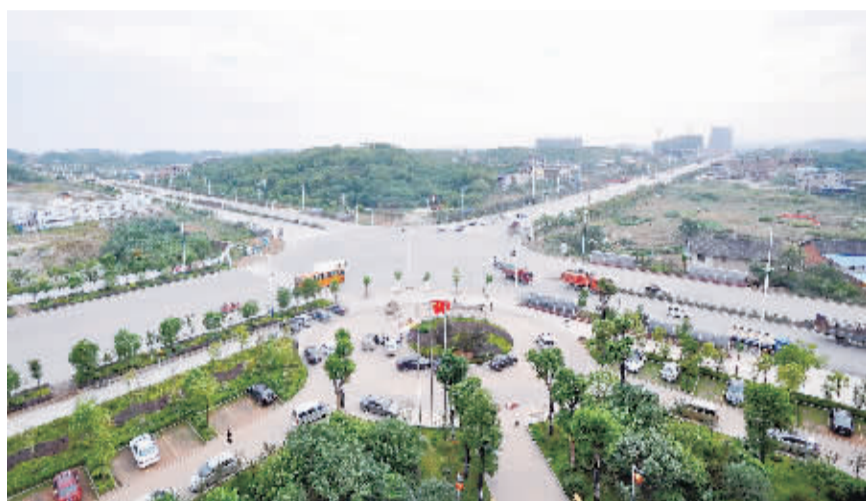
图为建设中的邵阳市宝庆工业集中区一角。

国有工业通过改制浴火重生，民营企业也异军突起。数据显示，仅2004年全市新发展民营企业1852家，总投资40亿元。