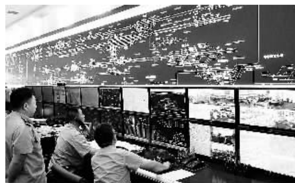
大秦重载枢纽郑州东站集控楼是太原铁路局在大秦线上建设的集车、机、工、电、辆、供电和通信7个系统部门为一体的行车调度指挥集中作业场所，配备全路最先进的列车运行集中控制系统以及车辆故障检查系统，为大秦重载列车安全运行提供了可靠的技术保障。图为工作人员在集控楼调度中心监测数据。

晶能光电首席执行官王敏透露，高性能硅基LED闪光灯产品为智能手机、汽车及通用照明等领域提供了全方位解决方案。该公司硅氮化镓LED技术一大优势是可利用大尺寸半导体制造工艺来降低LED成本。