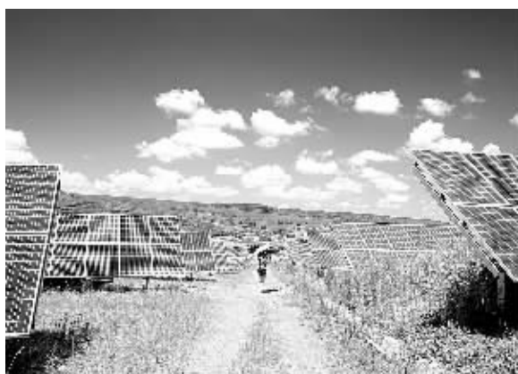
图为黑龙江牡丹江马桥河金跃太阳能发电厂。截至2014年6月底,黑龙江省共运行光伏电站7座,装机容量为1.0742万千瓦。上半年全省节约标煤185万吨,减少二氧化碳排放332万吨。

据了解,供销合作总社现有主管全国性社团组织14家,包括中国棉花协会、中国食用菌协会、中国茶叶协会、中国畜产品协会、中国果品流通协会等。社团深化改革10年来,为农服务水平大大增强,参与制定、修订国际标准、国家标准和行业标准100多项,培养各种涉农专业人才18万人次。